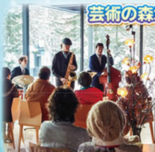
1月20日(土) 関口雄輝記念美術館