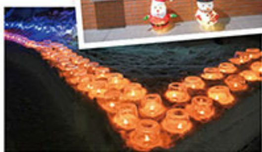
1月20日(土)・21日(日) 札幌芸術の森