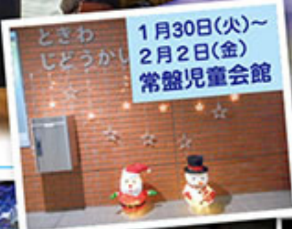
1月30日(火)~ 2月2日(金) 常盤児童会館