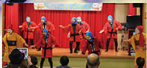
2月11日(日) 保養センター駒岡